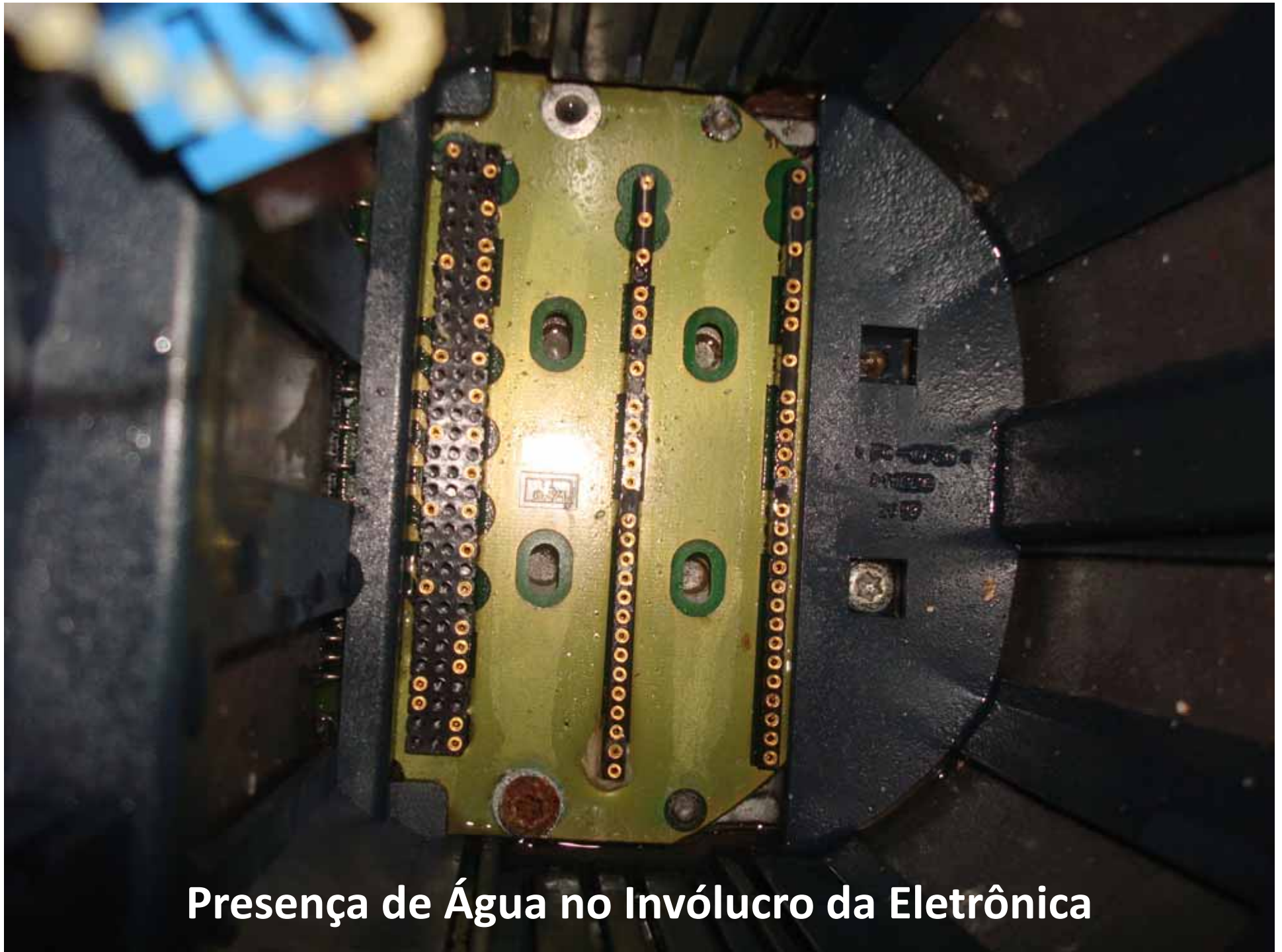
Presença de Água no Invólucro da Eletrônica