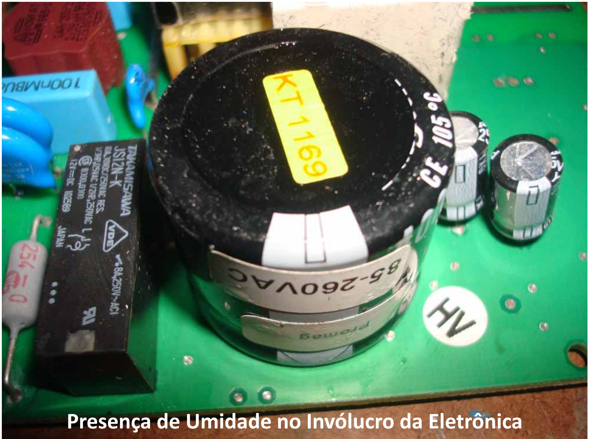
Presença de Umidade no Invólucro da Eletrônica