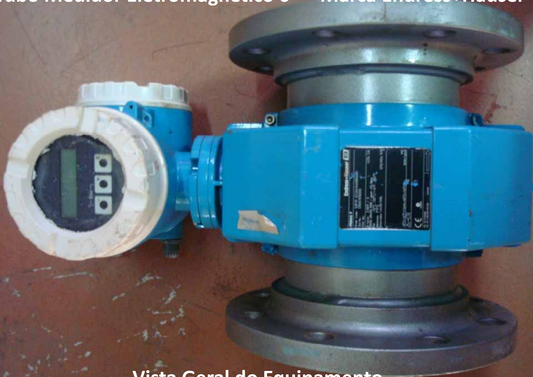
Vista Geral do Equipamento