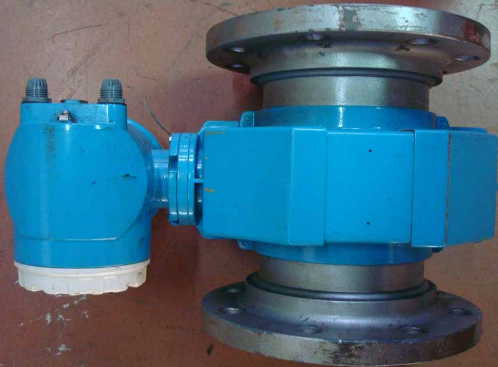
Vista Geral do Equipamento