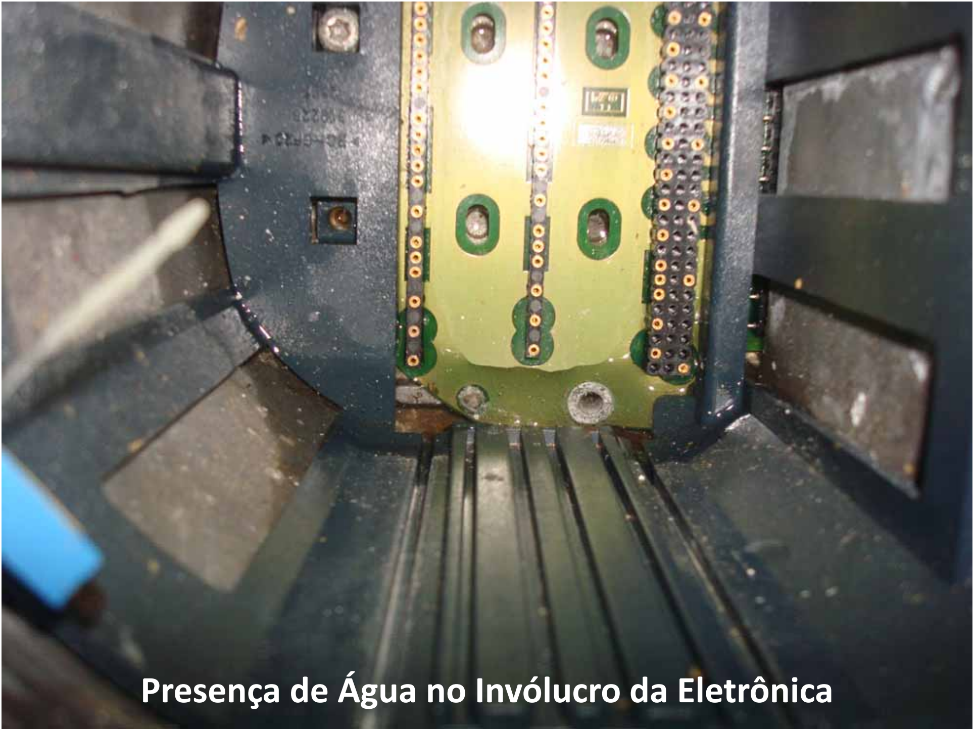
Presença de Água no Invólucro da Eletrônica